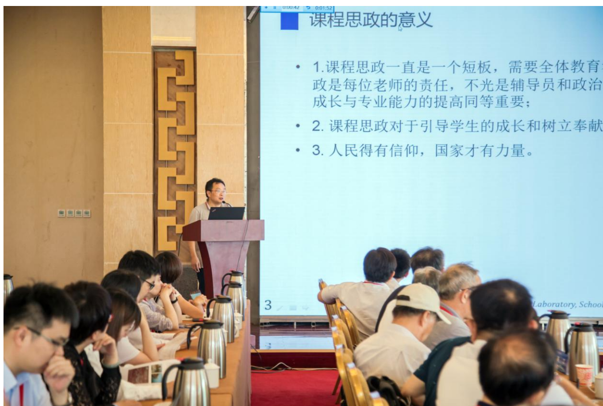
大会以“金课、慕课和课程思政”为主题进行集中交流讨论。