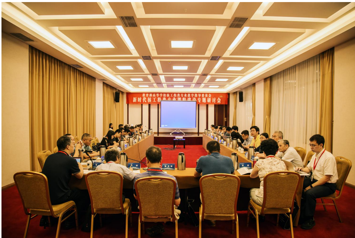
会议分组讨论中的第一组“金课组”。