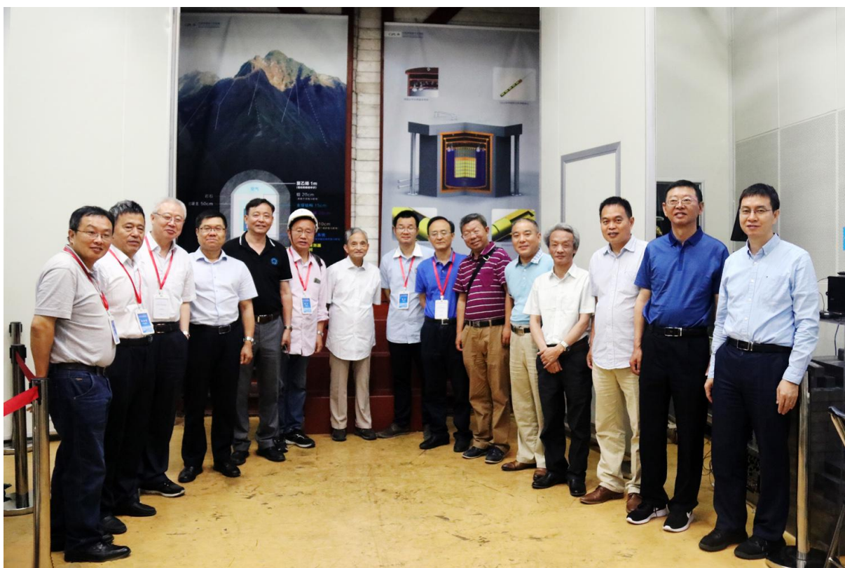
会议特别安排与会代表参观了中国锦屏极深地下实验室（CJPL）。