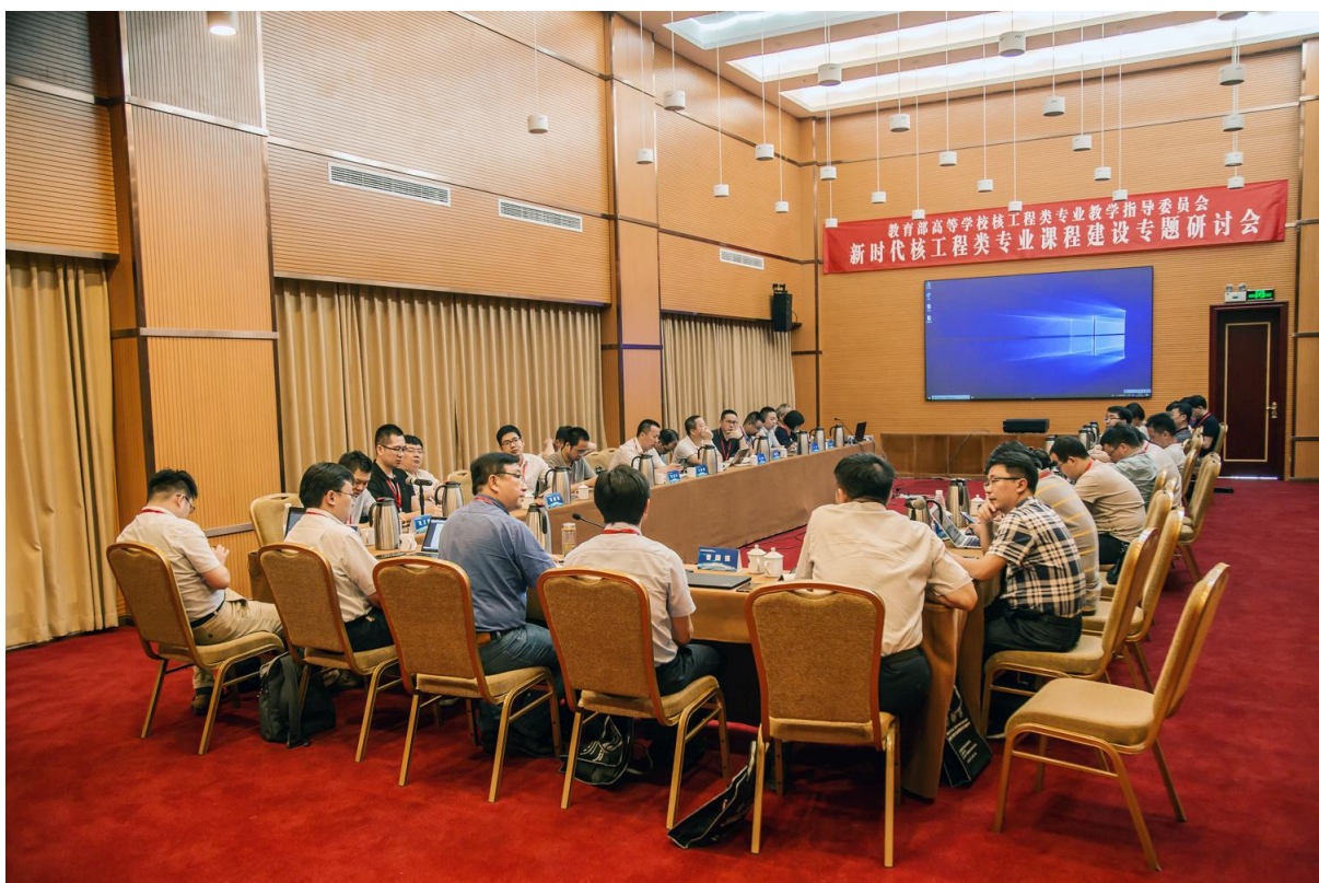
会议分组讨论中的第二组“慕课组”。