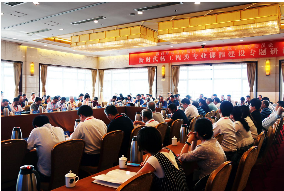
会议分组讨论中的第三组“课程思政组”。